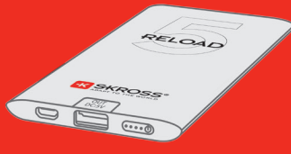
BATTERIES Energy boost on the go