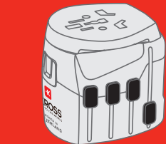
TRAVEL ADAPTERS World and country specific (2- & 3-pole)