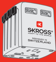
USB CHARGERS Charge all your USB devices